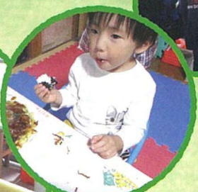
食事は盛り付けから片付け まですべて自分で行います。