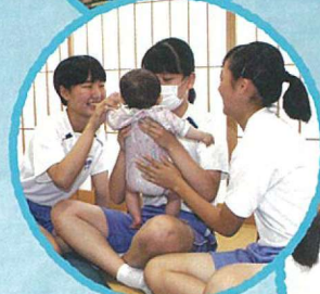
胎児の写真を見ながら 妊娠中の心境を聞いている様子