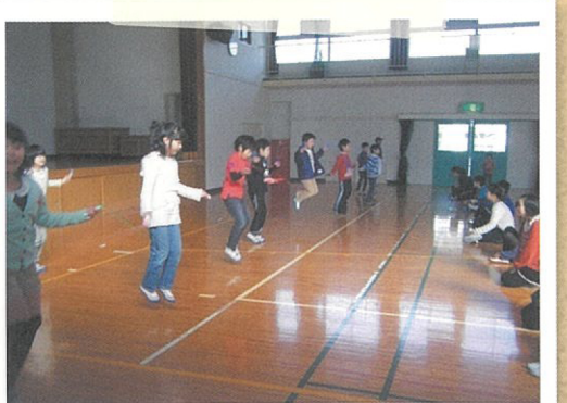
屋島東校区 なわとび大会

かるたとり大会に出場。練習も本番も元気いっぱい!! 2月2日、まるで春のような暖かさの中、「新春子どもフェスティバル2014」が開催されました。屋島西校区キッズクラブは、低学年チーム5名、中学年チーム4名、高学年チーム5名で「かるたとり大会」に出場しました。惜しくも1回戦、2枚差で負けて悔しい思いをしましたが、たくさんのご意見を吸収したと思います。