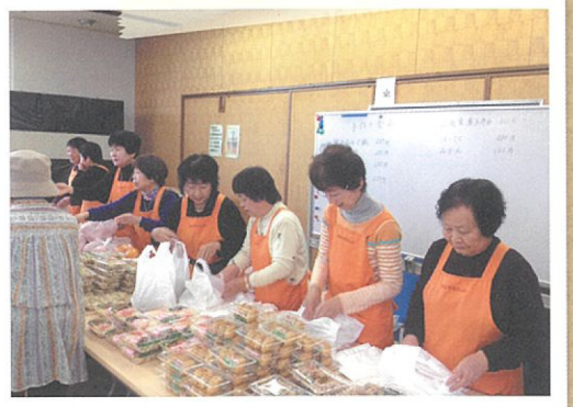
屋島女性福祉の会 チャリティバザー

ちょっとがんばりすぎ! 明日は身体が痛いかも? 3月9日(日)9時から屋島西小学校体育館に24チーム約300名の参加者が集まり1回戦は8ブロック各2試合、2回戦はブロック1位によるトーナメント競技が行われました。連覇を狙った藤目は2回戦で涙のみ、決勝はヴィラ檀の浦北と両の対戦となりました。決勝戦は大接戦となりましたがヴィラ檀の浦北が勝ち、初めての優勝を飾りました。