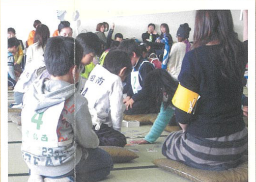
新春子どもフェスティバル2014

体験して実感しました。初めてでは、なかなかうまくいきません。 12月1日(日)屋島小学校に950名が集まり防災訓練を実施しました。地域の16の自治会ごとに集まり学校まで避難し体育館に集合。その後4班に分かれ①AEDを使った心肺蘇生訓練②簡易担架の作成搬送訓練③土のう作り④水消火器による消火・バケツリレーによる消火訓練を行いました。