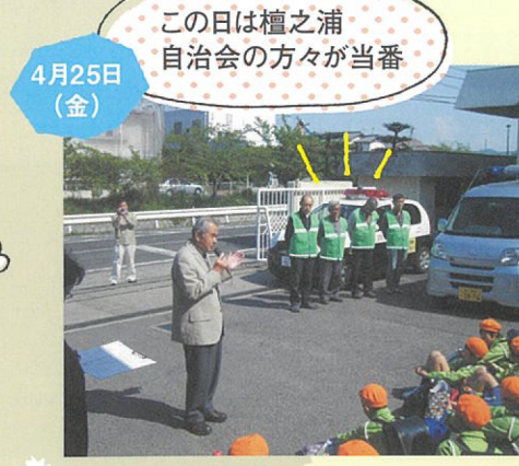
屋島東小学校における出発式