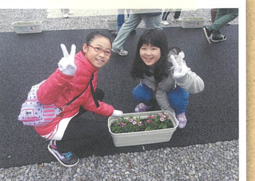
植栽プランを成功させよう!

冬の寒さを吹き飛ばして優勝目指してがんばったよ! 子どもたちの心身の健全育成を図ることを目的に毎年行われています。予選を突破して決勝に進出した子どもたちは、各学年の種目ごと数多く跳べるかを競いました。6年生の二重跳びでは100回を超える記録も出ました。高学年は、自分の競技以外に記録係や誘導係など自主的に任され大会がスムーズにできました。