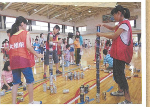
屋島校区子ども大会

2年に1度! 売り切れ続出で、今年も大好評でした 毎回好評のバザーでは、今年も始まる前から大行列。開場と同時に一気に人が溢れ、人気のあるものから次々と売り切れました。オススメは、当日の朝に手作りしたばかりのちらし寿司、炊き込みご飯や赤飯など。本格的な味が楽しめる、100円のお茶席も大人気で、初めてお抹茶をいただく子どもたちの姿もありました。