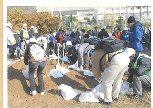
屋島小学校区 防災訓練